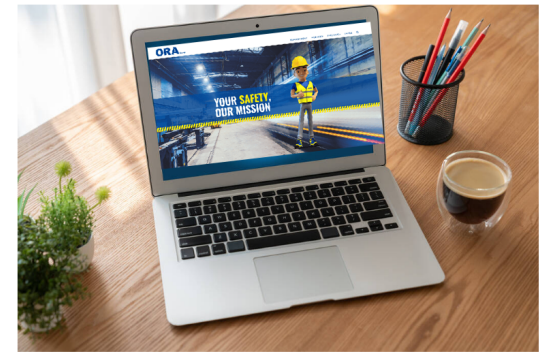
Vul zelf deelnemers in