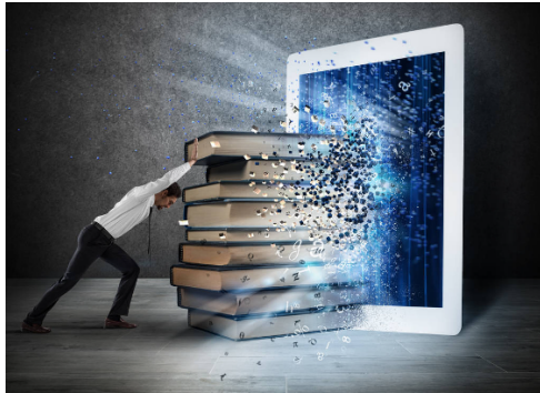
Centralisatie van opleidingsgegevens