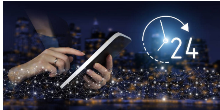
24/7 online consulteerbaar